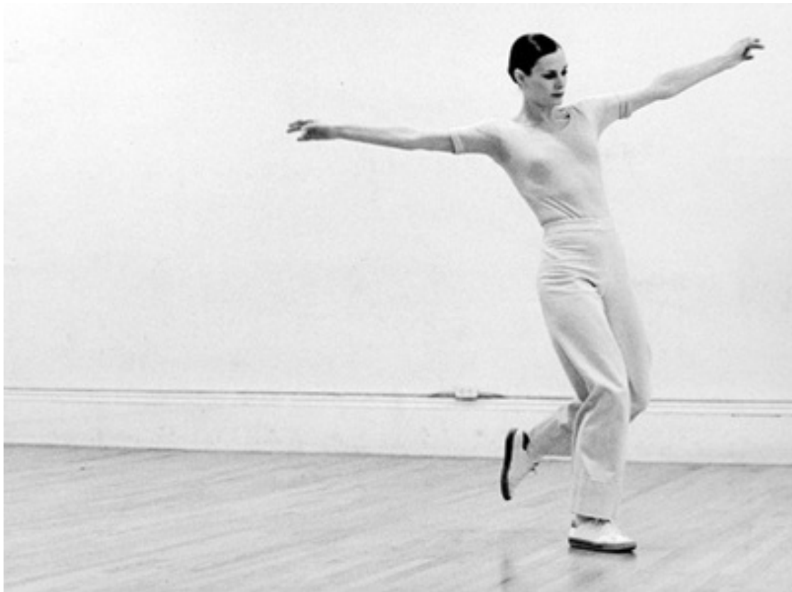
Lucinda Childs

"J'avais besoin de sortir du monde des objets et des matières. J'avais envie de revenir au mouvement, aux simples idées de mouvement, sans dépendre autant de la manipulation d'objets et de matières." Lucinda Childs